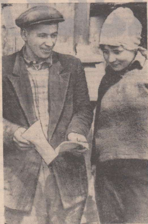
С любым делом справятся. Ни разу не сказали, что не сумеют.