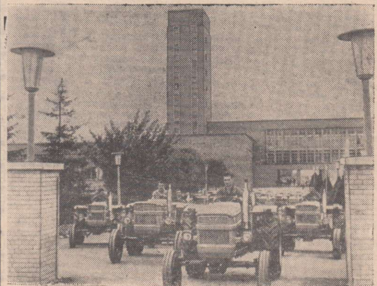
На снимке: новые тракторы «У-400» мощностью 40 л. с. покидают территорию Брашовского тракторного завода. Предприятие, сооруженное за послевоенный период, выпустит в этом году 25 000 машин.