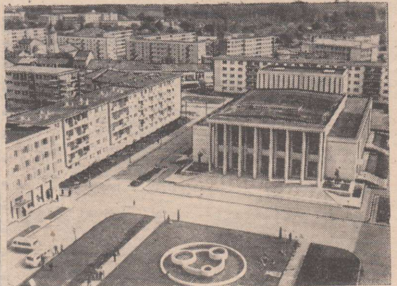
Вид города Георге-Георгиу-Деж. В центре — Дворец культуры молодежи.